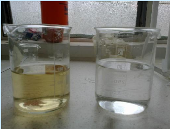
Δείγματα νερού εξόδου